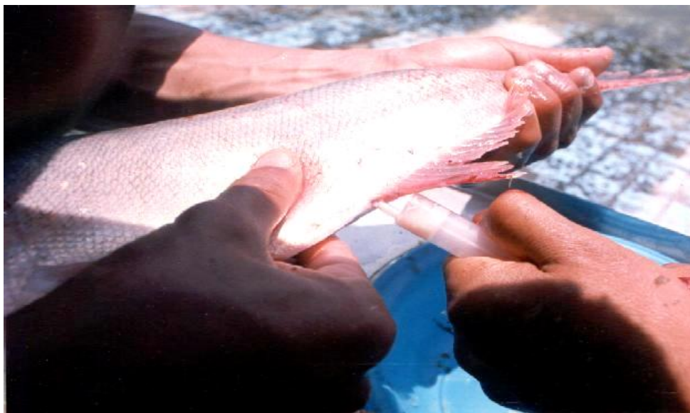
Figure 5 : Collecte des gamètes chez H. molitrix par stripping.

Dans les 4 lots, tous les mâles traités à l'extrait hypophysaire ou à la Testostérone Enanthate étaient spermants (Fig. 5).