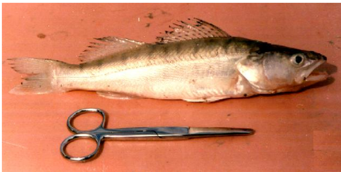
Figure 1: Sander lucioperca (Sandre).

Les géniteurs ont été prélevés dans le milieu naturel. Les spécimens S. lucioperca (Fig. 1) et C. carpio (Fig. 2) ont été pêchés dans le barrage de Harreza (Wilaya d'Ain Défia). Les carpes chinoises H. molitrix (Fig. 3) et A. nobilis ont été collectées dans la retenue collinaire de Merjet El Amel (Wilaya de Relizane). Les géniteurs sélectionnés ont été transférés vivants vers des bassins (15 m 3 ) et race-way (2 m 3 ) respectivement pour les carpes et les sandres. Les conditions d'expérimentations sur les carpes ont été réalisées à ciel ouvert au niveau de la station piscicole du barrage de Harreza (wilaya d'Ain Défia), avec un débit permanent d'eau (circuit ouvert) assurant un renouvellement total du volume d'eau des bassins toutes les 6 heures. La température ambiante saisonnière fluctuait entre 15°C et 22 °C. Durant la période de conditionnement (3 à 4 jours) aucune alimentation n'a été fournie aux carpes. Les sandres ont été nourris avec des spécimens Pseudophoxinus callensis et Gambusia affinis qffinis .