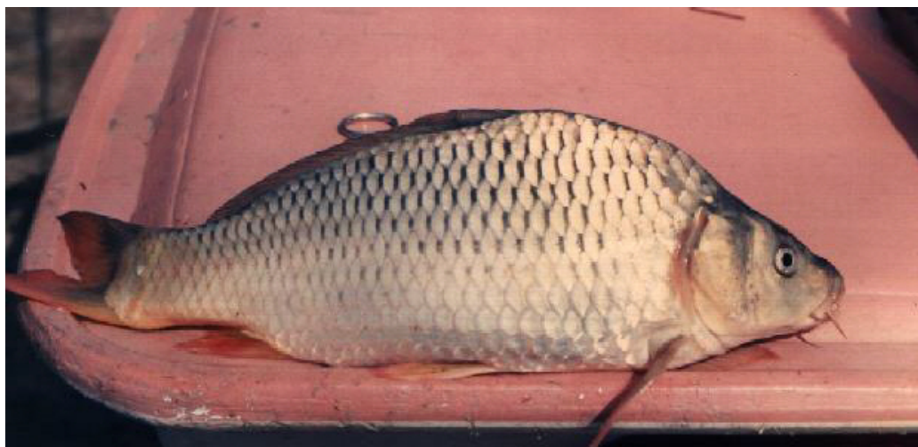
Figure 2: Cyprinus carpio (Carpe Miroir)