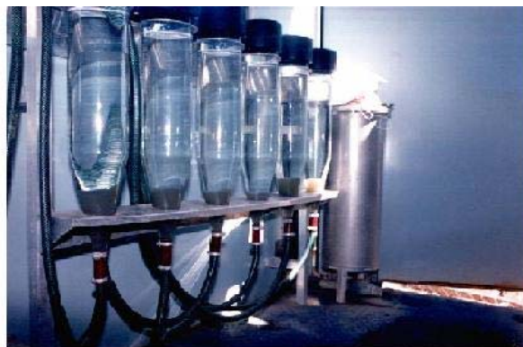
Figure 7 : Bouteilles de Zoug pour l'incubation des oeufs de carpes