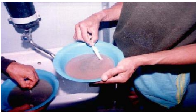
Figure 6 : Mélange des gamètes dans la solution fécondante.

effectuée avec la laitance mélangée des trois mâles ( Fig.6 ). Nous avons calculé pour ce lot un taux de fécondation de 94%. Après 36 heures d'incubation à 22°C ( Fig. 7 ), le taux d'éclosion a été évalué à 44,2 %.