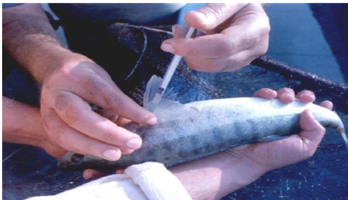
Figure 4 : Hypophysation du sandre Sander lucioperca par injection intra pelvienne d'extraits