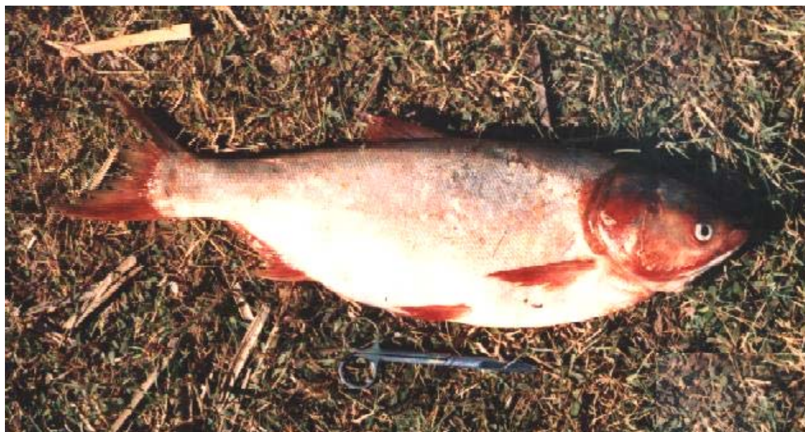
figure 3 : Hypophthalmichthys molitrix (Carpe argentée).